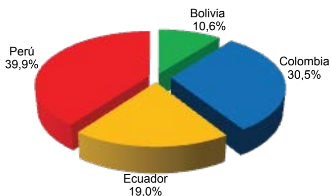
Comunidad Andina: Heridos por accidentes de tránsito, 2014 (Estructura porcentual)

Según estructura porcentual, el Perú concentró el 39,9% de los casos de heridos por accidentes de tránsito en la Comunidad Andina, seguido de Colombia con el 30,5%, Ecuador con el 19,0% y Bolivia con el 10,6%.